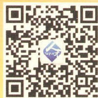
阳澄湖人才微信公众平台