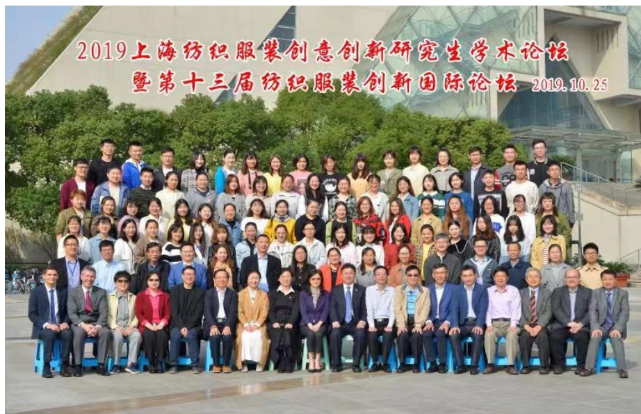
上海纺织服装创意创新研究生学术论坛暨纺织服装创新国际论坛照片