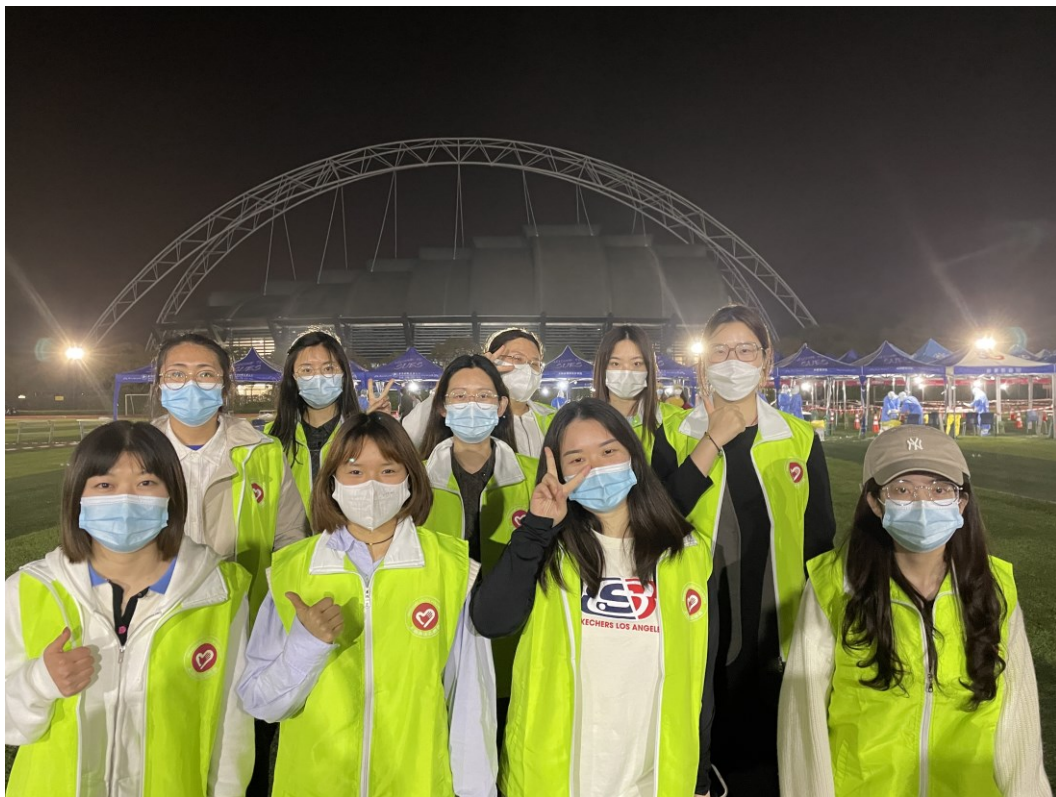
马克思主义学院研究生志愿者在抗疫前线展现青春风采