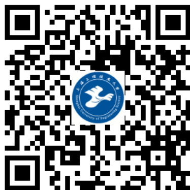
“上海工程技术大学研招网”