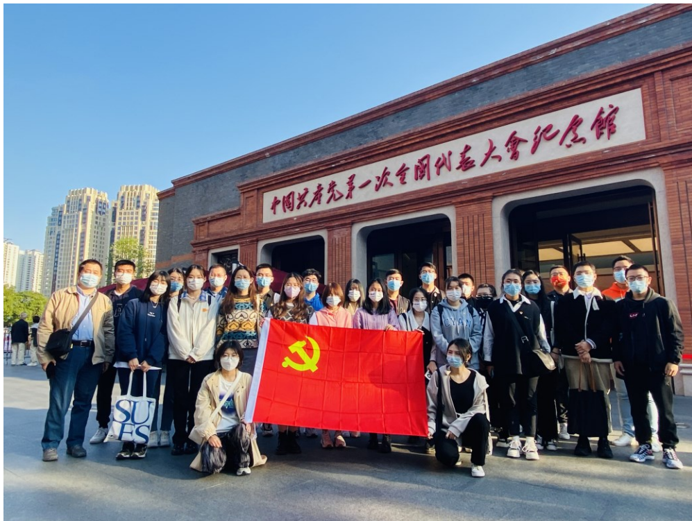
马克思主义学院研究生参观中国共产党第一次全国代表大会纪念馆