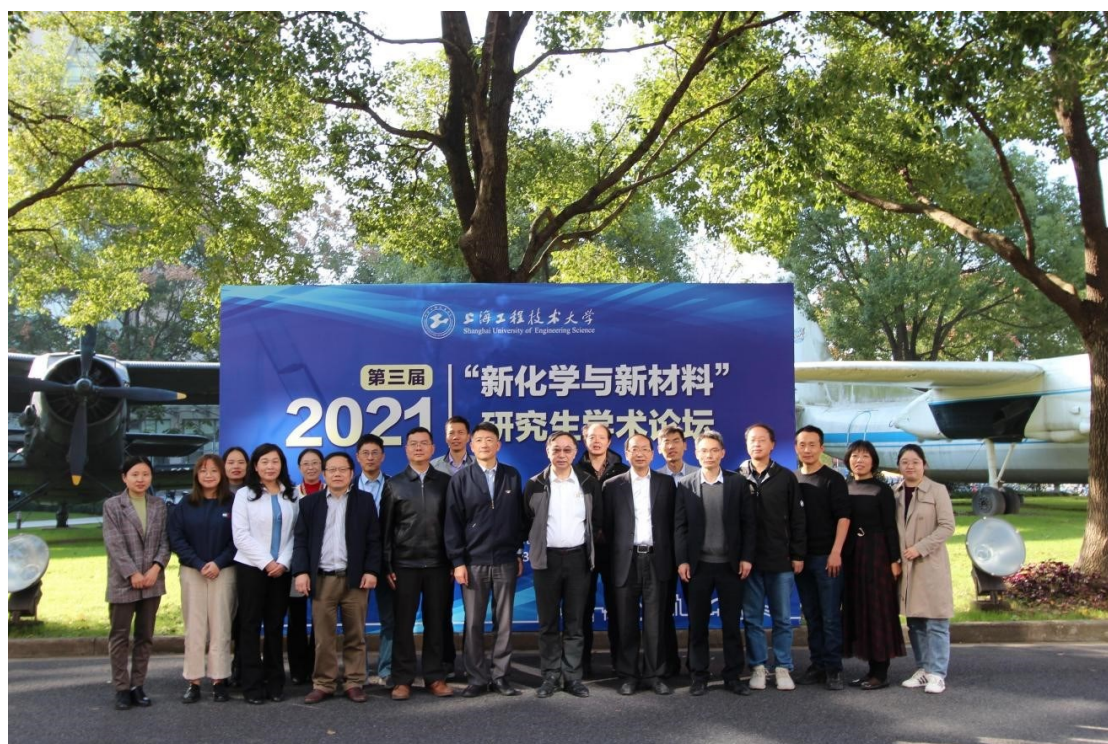
第三届新化学与新材料研究生论坛

学院多年来十分重视对硕士研究生的培养工作，在加强理论基础学习的同时更注重对研究生实践能力和创新能力的培养，5 年来，学院培养的研究生在全国和上海市各类创新创业大赛中屡获佳绩，多名毕业研究生获得国外一流大学全额奖学金录取攻读博士学位，研究生就业率连续多年达到 100%。