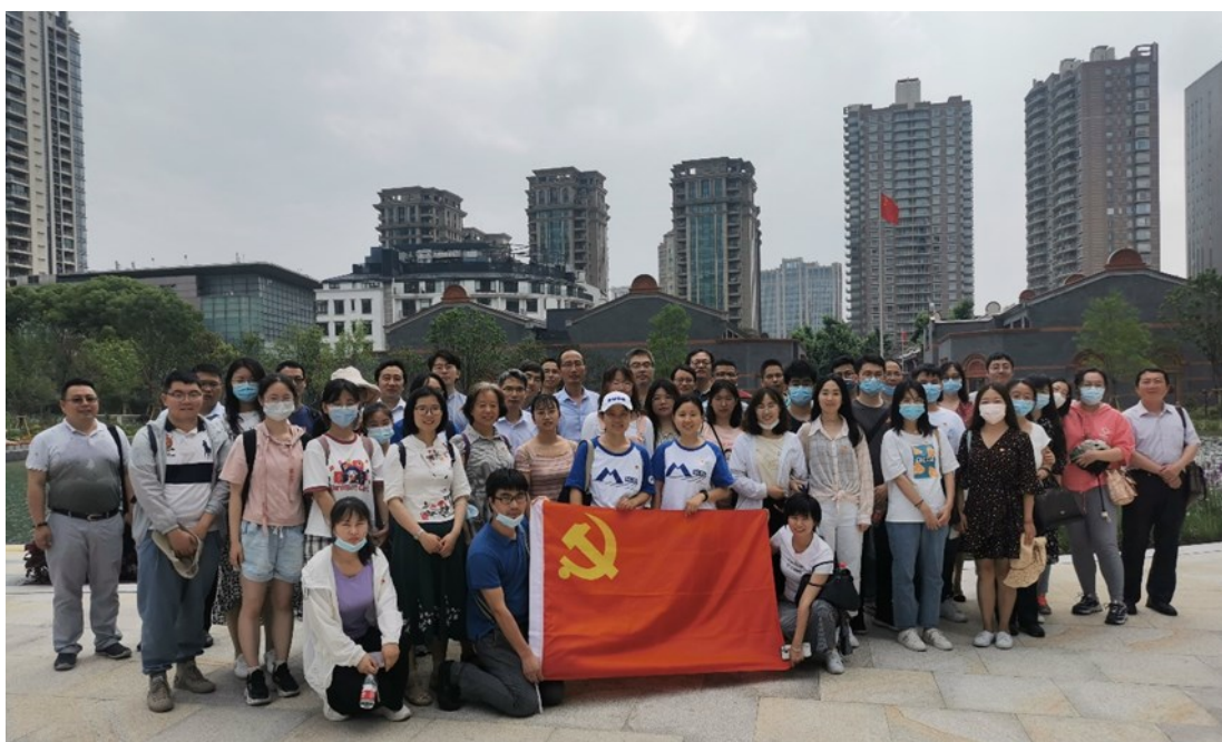
建党百年于中共一大会址学习