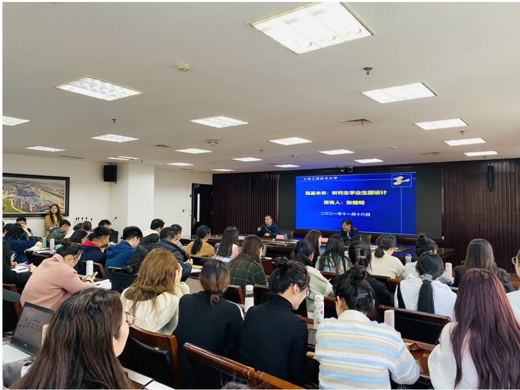
马克思主义学院研究生在聆听学术讲座