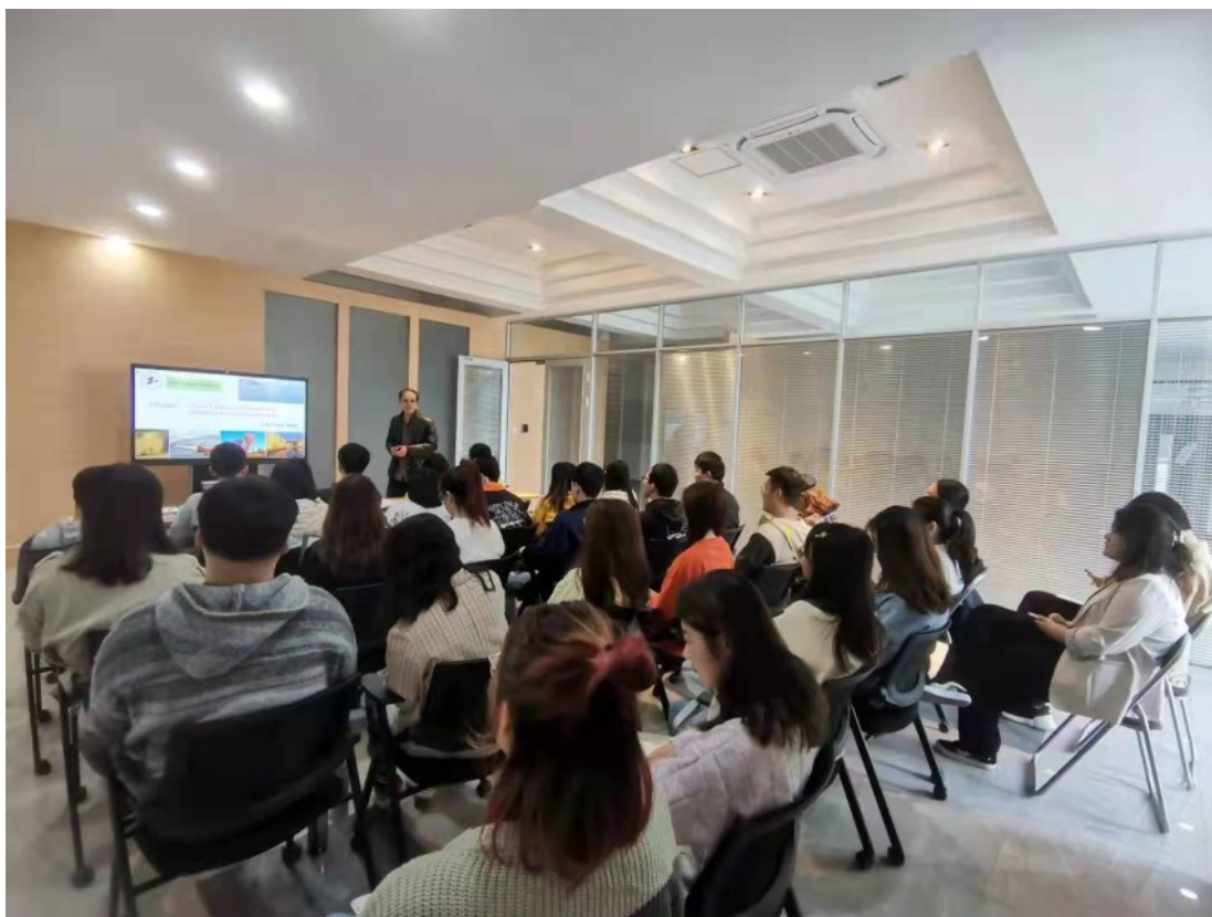
教授开展学术前沿讲座