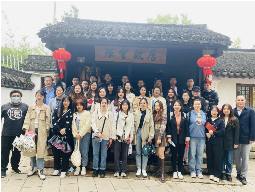
马克思主义学院到陈云纪念馆开展现场教学，研究生们在陈云故居前留影。