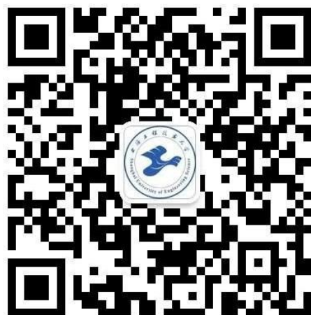
“上海工程技术大学研究生教育”